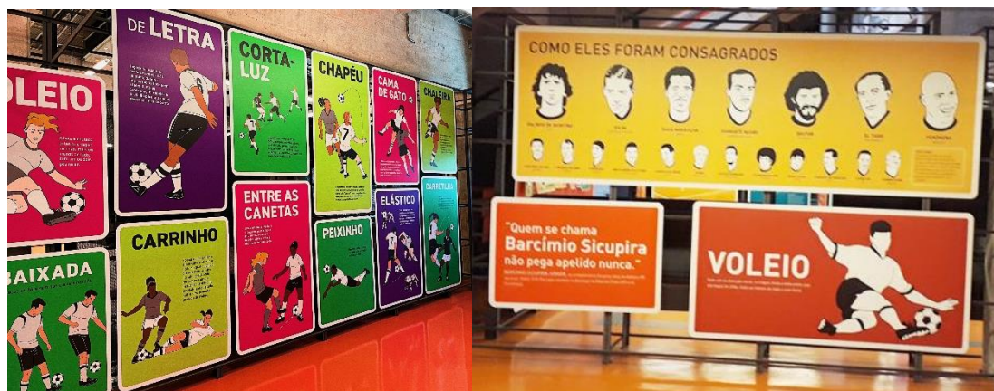
Imagens referência para a estética de almanaque: